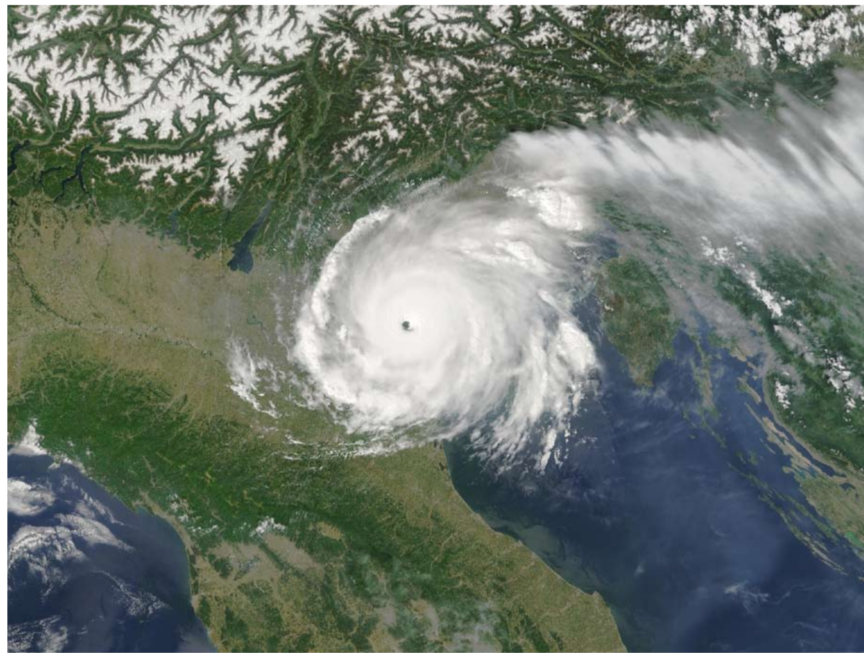
"Il vortice dell'innovazione": immagine della campagna di lancio di INNOVeTION VALLEY