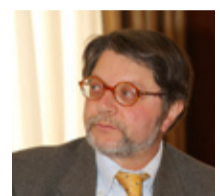
di Enzo Rullani*

Il terziario in passato era definito come un settore residuale, in base al critero della non-meccanizzazione di attività ancorate a prestazioni non stoccabili e non trasferibili .