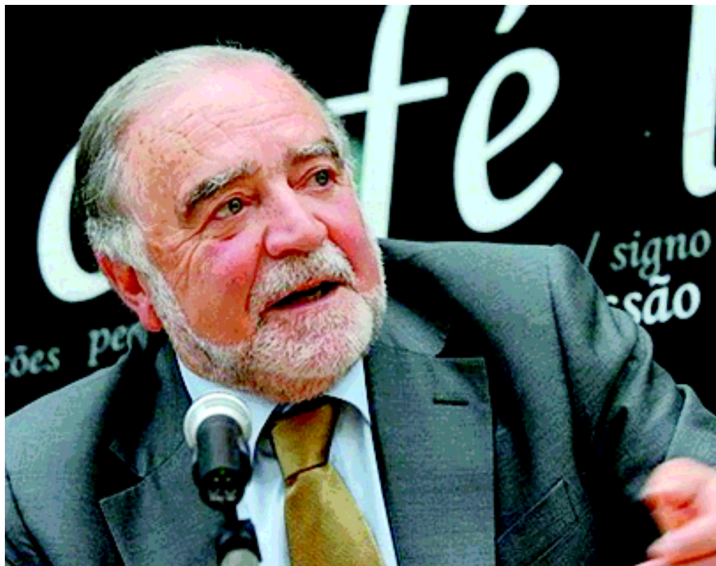
Manuele Alegre: prima la resistenza poi un'intensa vita politica in Portogallo

Alle 16.30 in Sala Paladin del Municipio, cerimonia di conferimento del Sigillo della Città (Cittadinanza onoraria) da parte del Sindaco di Padova, quale riconoscimento al poeta e al combattente per la libertà e la democrazia.