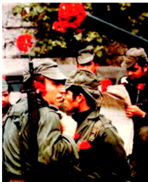
25 aprile 1974: la rivoluzione dei garofani

L'omaggio all'uomo che ha combattuto a viso aperto per la libertà del suo Paese e ora si candida alle presidenziali