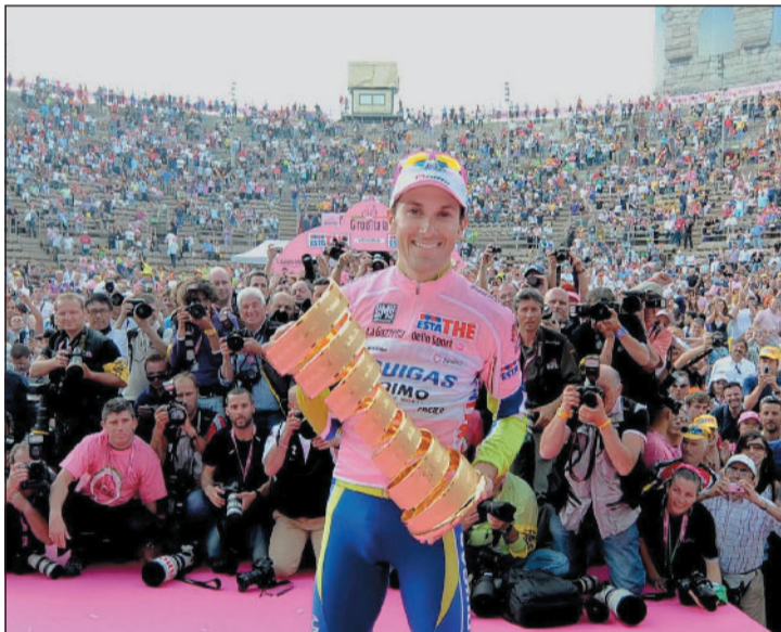
Ivan Basso coglie all'Arena di Verona il secondo trionfo rosa della sua carriera dopo lo stop per doping. Un successo conquistato sulle montagne e difeso nell'ultima cronometro del Giro d'Italia.