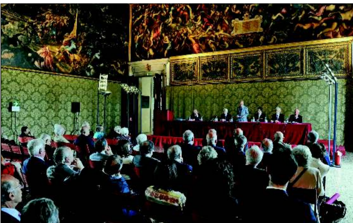
VENEZIA L'adunanza di ieri dell'Istituto Veneto di scienze lettere e arti