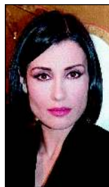
REGISTA Claudia Koll, ex sexy diva

bottega dell'orafo", cominceranno questa estate nell'entroterra delle Marche. La storia, una meditazione sulle nozze cristiane, ruota attorno alla vita di tre famiglie e due coppie di giovani che si sposano alla vigilia dell'invasione nazista della Polonia. Famiglie con problemi diversi, unite da un elemento: la bottega dell'orafo (che sarà ricostruita in una vera gioielleria di Fabriano) dove sono state acquistate le fedie delle coppie.